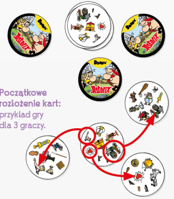
Początkowe rozłożenie kart: przykład gry dla 3 graczy.

Dwóch Rzymian, Juliusz Cezar i legionista, ukrywa się w wiosce. Można ją obronić tylko w jeden sposób – dając przeciwnikom po galijsku z liścia. Jeśli któryś z tych 2 symboli pojawi się na środkowej karcie, gracz może go głośno nazwać i klepnąć kartę na stosie dobierania, nawet jeśli na jego karcie nie ma tego symbolu. Gracz, który położył dłoń na stosie jako pierwszy, zabiera kartę i kładzie ją na wierzchu swojego stosu.