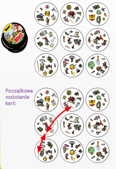
Początkowe rozłożenie kart: