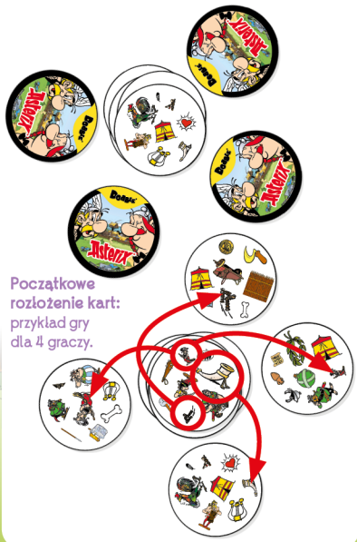
Początkowe rozłożenie kart: przykład gry dla 4 graczy.