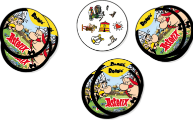
Początkowe rozłożenie kart: przykład gry dla 3 graczy.