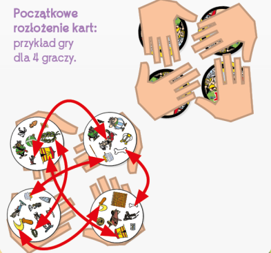
Początkowe rozłożenie kart: przykład gry dla 4 graczy.